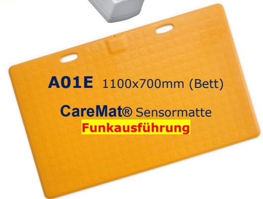
A01E 1100x700mm (Bett)