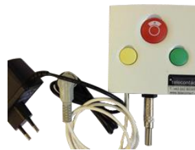
EasyControl Schwesternruf-Modul für Kabelmatten (optional)