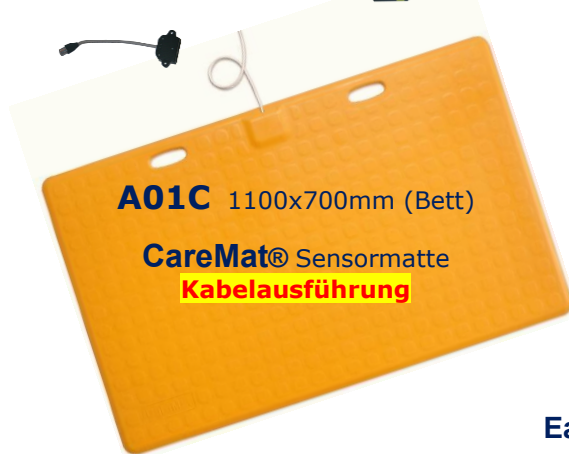
A01C 1100x700mm (Bett)