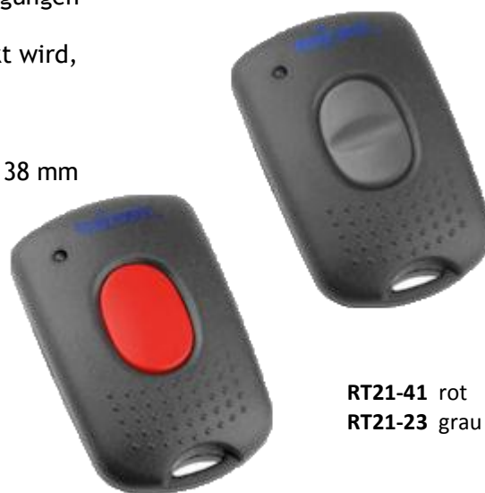
RT21-41 rot RT21-23 grau