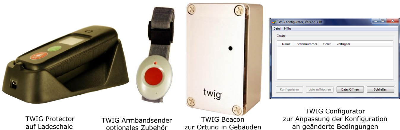
Twig Protector auf Ladeschale