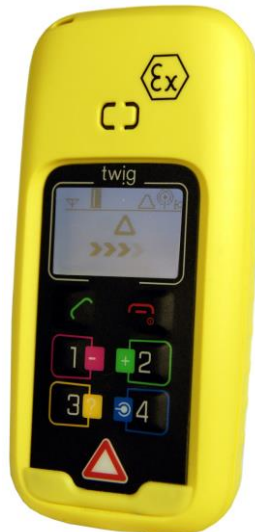
TWIG Protector ATEX II 2 G Ex ib IIC T4 Gb